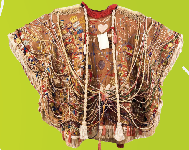
Manto da Apresentação, Arthur Bispo do Rosário,

História, ciência e senso comum estabelecem suas perspectivas de normalidade, no entanto, seguidamente, alguns indivíduos escapam a esses parâmetros obtendo grandes sucessos ou grandes fracassos. Sendo assim, o quão sensata é a loucura?